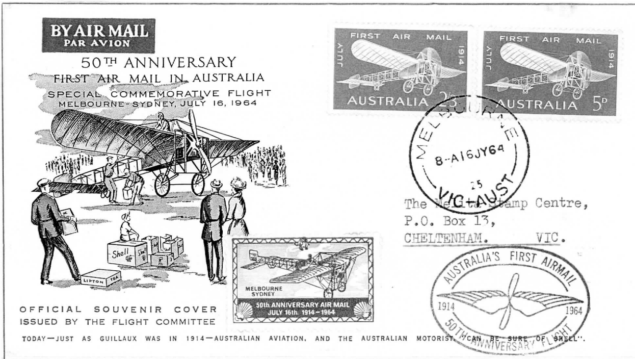
Enveloppe commémorative éditée pour le 50 ème anniversaire du premier courrier aéropostal australien, Melbourne – Sydney effectué par Maurice GUILLAUX sur BLERIOT XI du 16 au 18 juillet 1914. Timbres de 5d et 2/3 représentant le Blériot XI, départ Melbourne 16/7/64, arrivée Sydney 18/7/64.