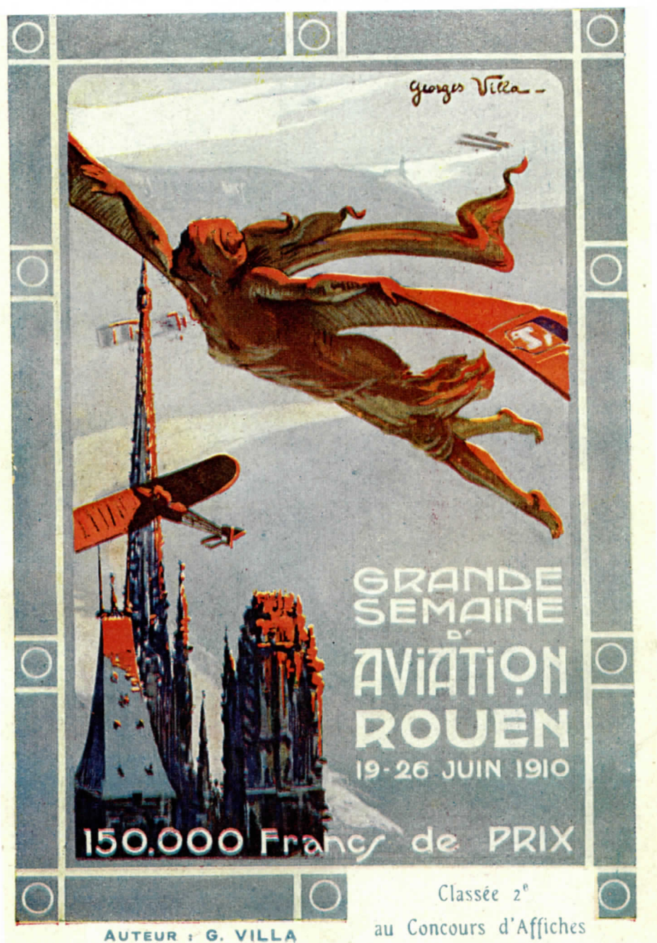
Une des affiches de la Grand Semaine d'Aviation de Rouen (19 au 26 juin 1910)

Grande Semaine d'Aviation de Rouen (juin 1910)